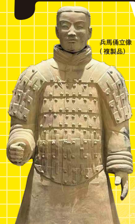
兵馬俑立像 (複製品)