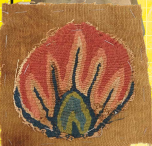
コプト布 (アフリカ)