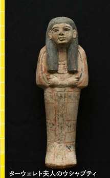
ターヴェレット夫人のウシャブティ