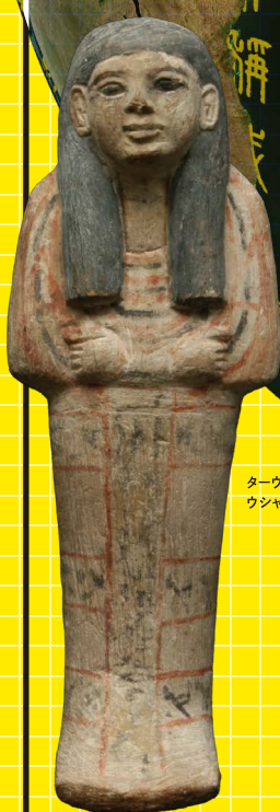
ターヴェレット夫人のウシヤブティ